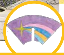
デザイン画：令和2年度優秀賞