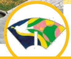
デザイン画：令和3年度優秀賞