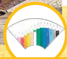
デザイン画：令和5年度優秀賞